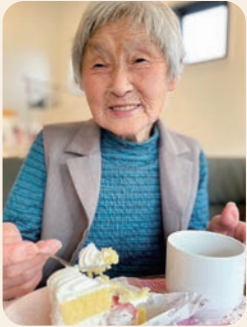
あつとほーむウエスト 「和洋スイーツで喫茶」 皆様から好評の リクエスト企画