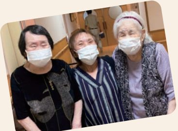
特別養護老人ホーム あつとほーむ若葉