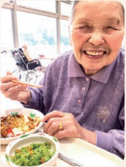
特別養護老人ホーム あつとほーむ若葉 「最高ね◎！」 選べるランチで不動の人気、 カレーライス