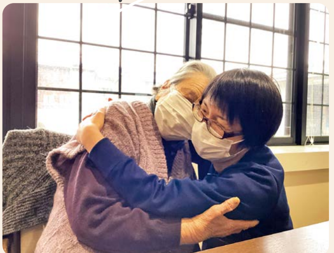
あつとほーむウエスト 「会えて安心した！」 地震後サービス再開 再会のハグ